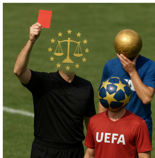
Image générée par IA

La construction d'un véritable droit européen du sport est donc en marche, mais elle reste fragile : entre autonomie des fédérations et respect du droit de l'Union, l'équilibre promet d'être délicat.